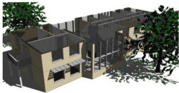
VERSCHATTUNG REALISTISCH DARSTELLEN UND MINUTENGENAU BERECHNEN